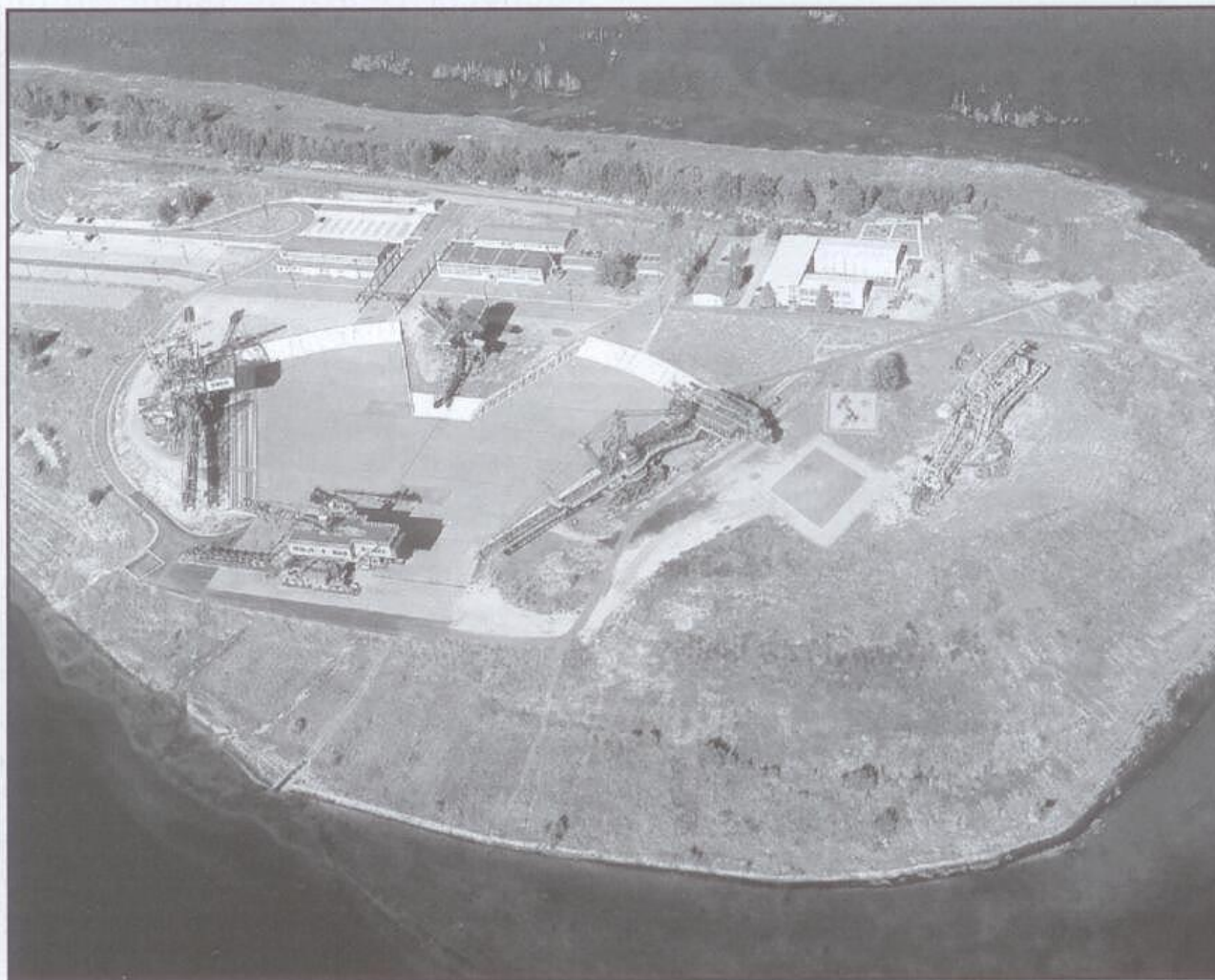
Rys. 4. Niemcy. Półwysep i miasto z żelaza (Ferropolis) - zagospodarowane wyrobisko po węglu brunatnym (autor nieznany)