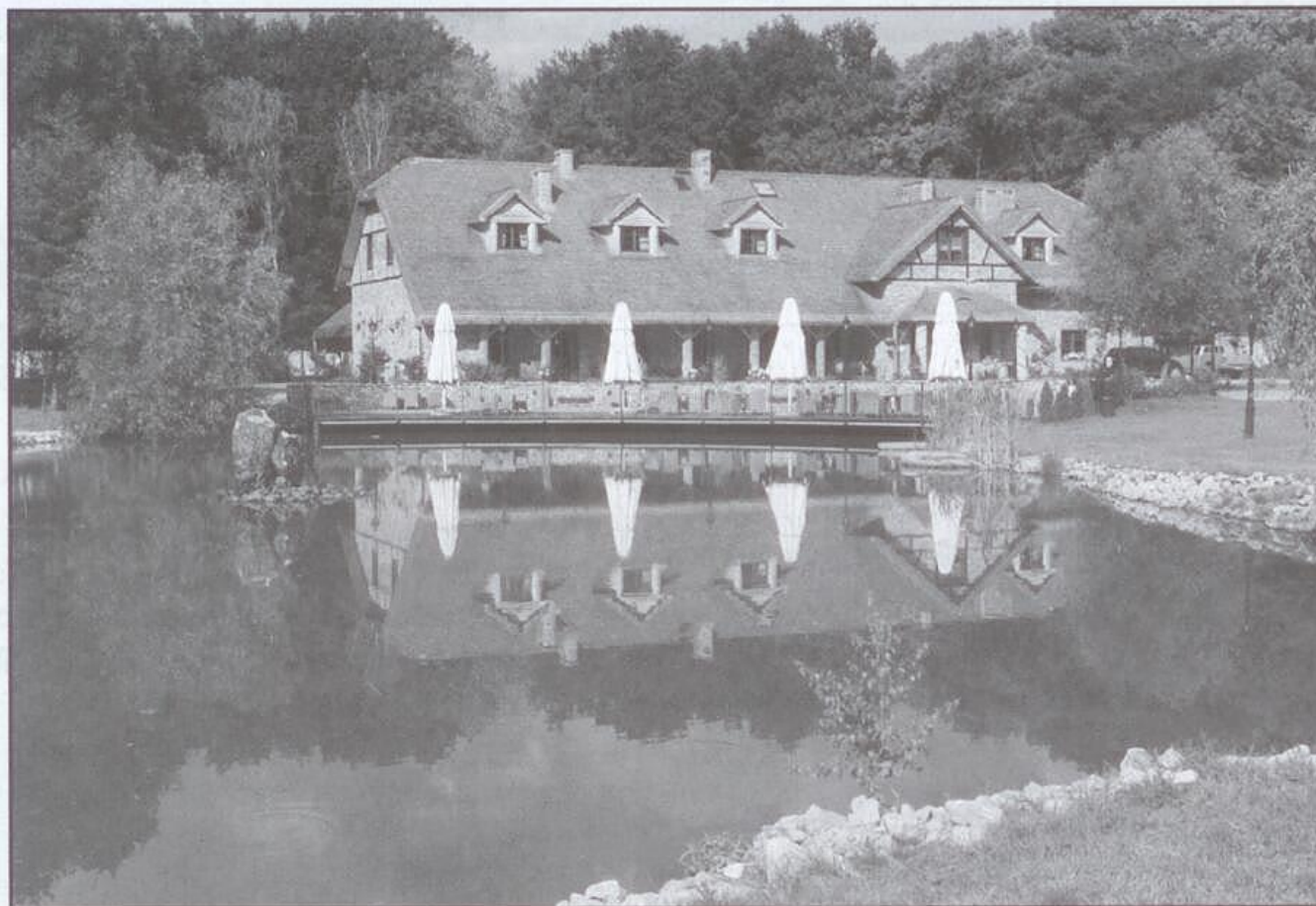
Rys. 1. Karczma Miłocin w przyjaznym otoczeniu zieleni i wody, przy zakładzie górnym PIERSZÓW

tego miejsca. Na terenie poeksploatacyjnym precyzyjnie zaplanowano domki letniskowe, łowiska dla miłośników wędkarstwa, place zabaw dla miłusińskich, miejsca dla organizowania dużych i kameralnych spotkań towarzyskich, wesel, konferencji. Obsługę gastronomiczną tego miejsca zapewnia Karczma Miłocin zlokalizowana w samym sercu obiektu, wykonana z naturalnych surowców tj.: łupka, drewna, gontu osikowego i kamienia polnego.